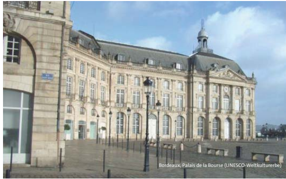
Bordeaux, Palais de la Bourse (UNESCO-Weltkulturerbe)

Während des ersten Jahres werden die Studierenden u. a. für die Unterschiede und Gemeinsamkeiten der deutsch- und französischsprachigen wissenschaftlichen Traditionen sensibilisiert. Im Laufe des Studiums erhalten sie eine besondere Betreuung und sie müssen ein Studienprojekt durchführen. Die beiden ersten Semester sowie das 6. Semester finden in Hamburg und die Semester 3 bis 5 in Bordeaux statt. Während der ganzen Studienzeit sind die Studierenden aus beiden Universitäten gemeinsam (sowohl in Hamburg als auch in Bordeaux); während des ersten Studienjahres haben die Studierenden aus beiden Sprachräumen die Gelegenheit, ein auf sie zugeschnittenes Tutorium zu besuchen, um ihre Sprachkompetenzen auf Französisch bzw. auf Deutsch zu vertiefen. Durch die Gruppendynamik innerhalb der Jahrgänge wird der Zusammenhalt unter den Studierenden gefördert: Es sollen Europäer ausgebildet werden, die in beiden Ländern zu Hause sind.